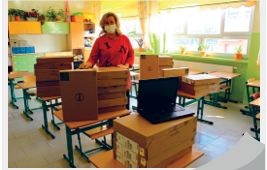
LAPTOPY DLA SZKÓŁ

Kolejne laptopy trafiły do wszystkich szkół podstawowych w Kędzierzynie-Koźlu. Od początku nauki zdalnej nasze placówki otrzymały blisko 340 nowoczesnych komputerów z legalnym oprogramowaniem. Sprzęt trafił zarówno do wykluczonych cyfrowo uczniów, jak i nauczycieli. Urządzenia zostały zakupione ze środków rządowych oraz europejskich.