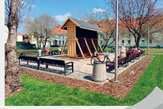
TEŻNIA NA POGORZELCU

Druga teźnia solankowa w Kędzierzynie-Koźlu powstała na osiedlu Pogorzelec w sąsiedztwie Domu Dziennego Pobytu nr 5. O jej budowie zdecydowali mieszkańcy, wybierając ten pomysł w ramach Budżetu Obywatelskiego, a strefa rekreacyjna przy ul. Kościuszki rozrosła się o nowe atrakcje. Wcześniej powstał tam plac zabaw i urządzenia do ćwiczeń na powietrzu.