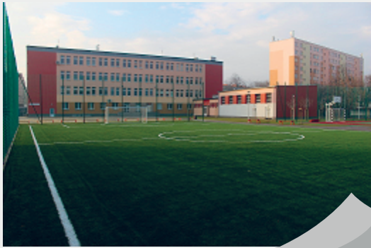
BOISKO PRZY PSP NR 6

Po starych betonowych boiskach pozostały wspomnienia. W ich miejsce powstał nowoczesny kompleks sportowy na miarę XXI wieku. Uczniowie PSP nr 6 trenują w przyjaznych warunkach. Do ich dyspozycji są dwa boiska z bezpieczną nawierzchnią i infrastruktura do uprawiania lekkoatletyki. Obiekt wyposażony jest w ławki, stojaki na rowery i oświetlenie.