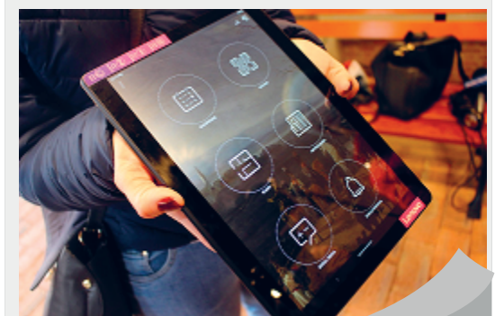
MUZEUW W APLIKACJI

Zwiedzanie Muzeum Ziemi Kozielskiej stało się jeszcze bardziej atrakcyjne. Wszystko za sprawą aplikacji, która tchnęła ducha współczesności w zgromadzone eksponaty. Darmowe oprogramowanie umożliwia skanowanie kodów QR, w które wyposażona jest wystawa stała. Posiada ono również szereg innych przydatnych funkcji.