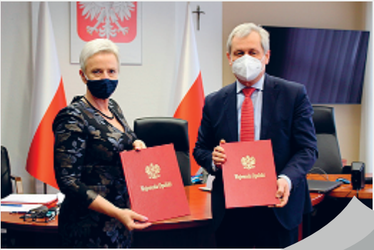
ŁĄCZNIK Z DOFINANSOWANIEM

Budowa mostu na łączniku do obwodnicy północnej będzie dofinansowana. W marcu podpisano pierwszą z umów, która zapewni środki na realizację tej kluczowej dla Kędzierzyna-Koźła inwestycji. Miasto skutecznie pozyskało środki zewnętrzne na opracowywanie dokumentacji. Blisko 700 tysięcy złotych pochodzi z Programu "Mosty dla Regionów".