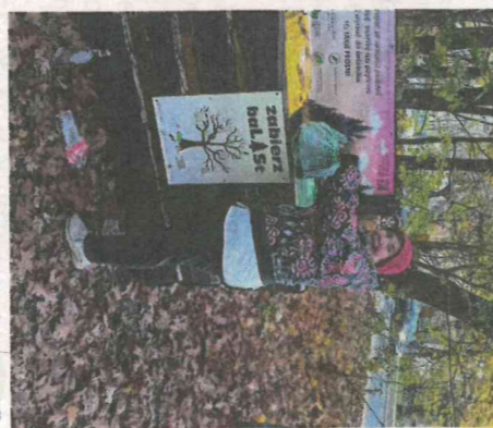
Pani Bronia to ambasador kampanii