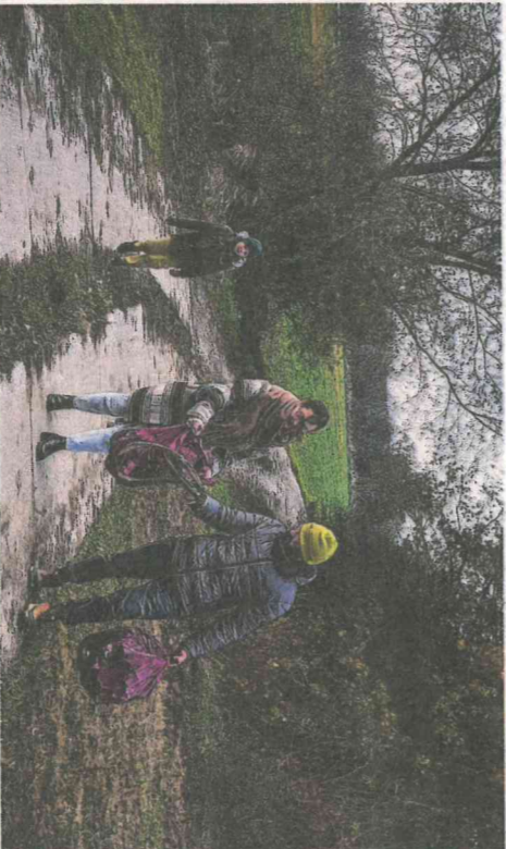
Pani Ola z całą rodziną też porządkuje las, a przy okazji wyprowadza psy ze schroniska w ramach wolontariatu