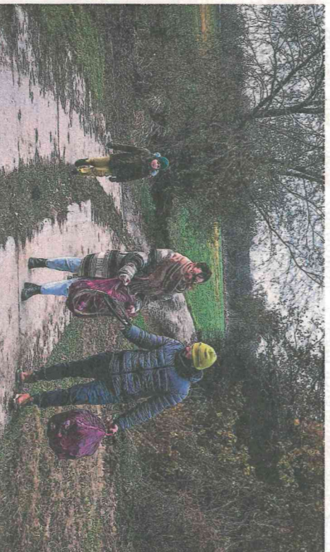
Pani Ola z całą rodziną też porządkuje las, a przy okazji wyprowadza psy ze schroniska w ramach wolontariatu