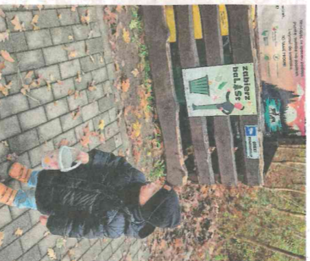
Maty Florian rozwija duże problemy