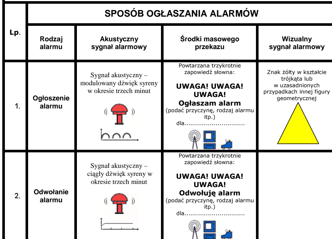
TABELA SYGNAŁÓW ALARMOWYCH